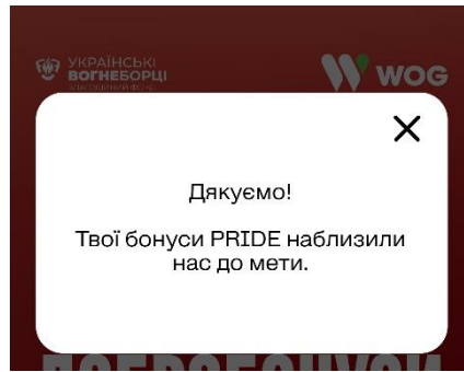
Рис.5 Екран з подякою

4.3. При досягненні мети Акції, зазначеної в п. 4.1. Правил, Організатор здійснить перерахунок благодійної допомоги Благодійному партнеру Акції у розмірі не менше 1 650 000 (Один мільйон шістсот п'ятдесят тисяч) грн без ПДВ.