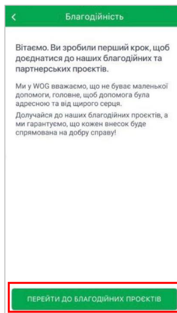
Рис.3 Розділ «Благодійність» в мобільному застосунку PRIDE

4.2.3. Натиснути на кнопку «Перейти до благодійних проєктів» (рис. 3).